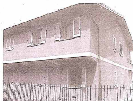
Un momento dell'inaugurazione e, sopra, la nuova struttura

"Il Cremasco si sta unendo - ha sottolineato - per dare risposte puntuali e adeguate ai tanti bisogni che ci sono in ambito sociale. Da soli non riusciremo a farvi fronte. Per questo vi ringrazio per quello che qui si sta contribuendo a fare."